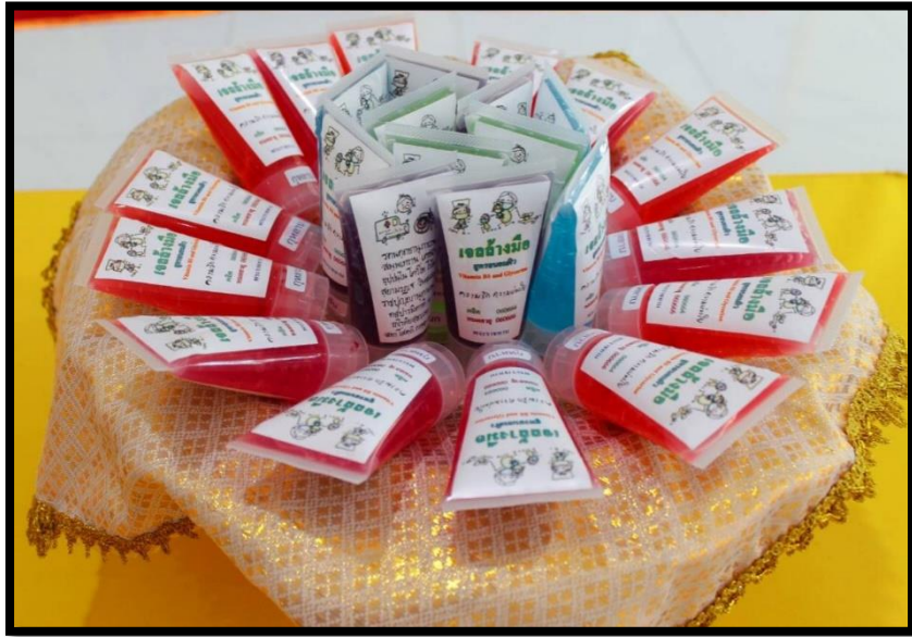
โรงพยาบาลพระพุทธบาท