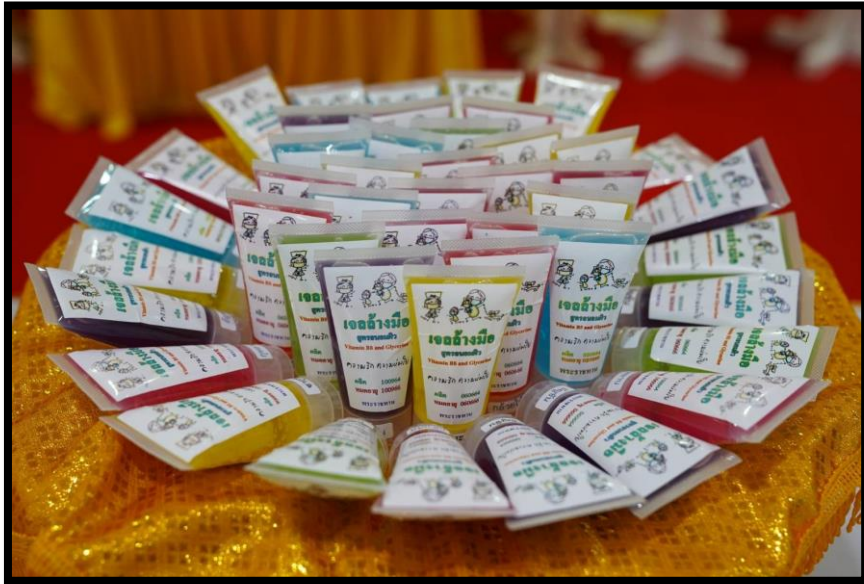
โรงพยาบาลค่ายบางระจัน จังหวัดสิงห์บุรี