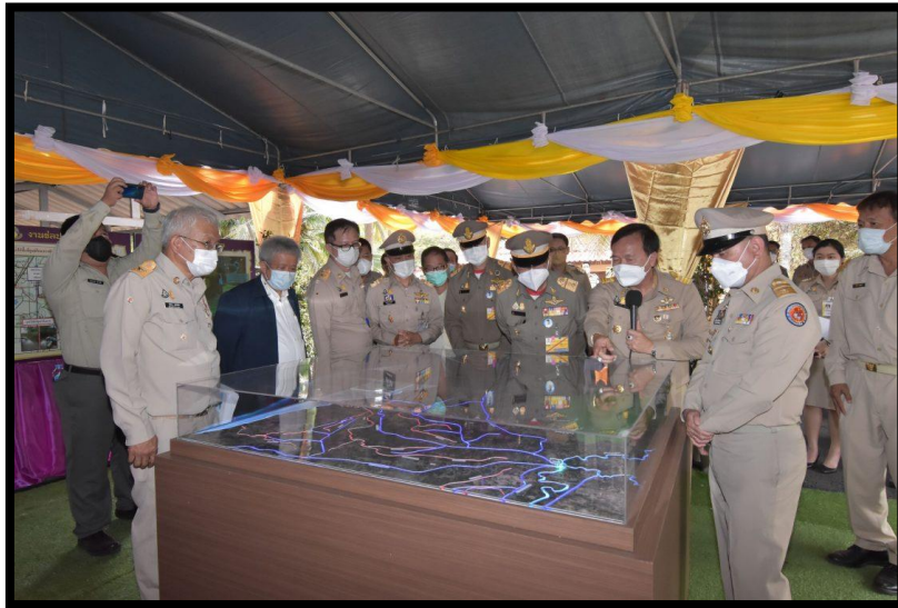
๒. เวลา ๑๐.๓๐ น.-ณ ทางระบายน้ำล้นราชประชานุเคราะห์ ๑๓ ตำบลปึกเตียน อำเภอกำแพง