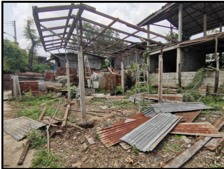
การรื้อถอนบ้านเดิม