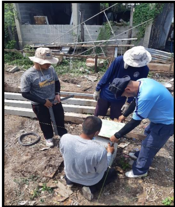
การก่อสร้างต้งเสา