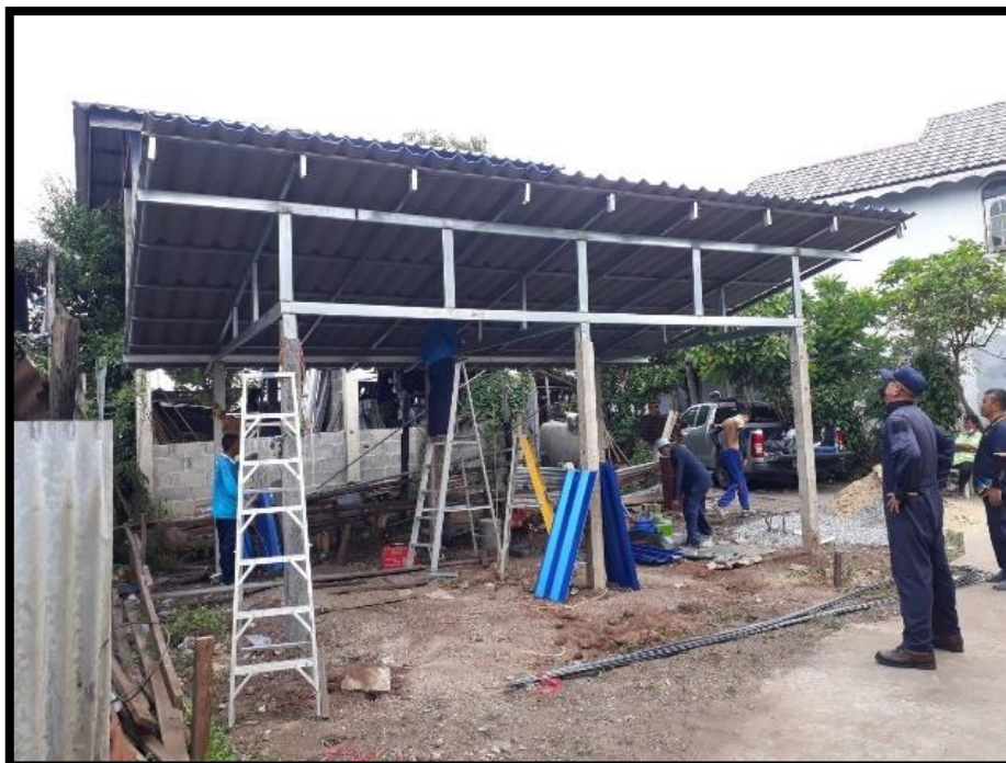
การสร้างหลังคา