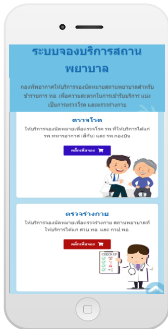
หน้าเข้าสู่ระบบ