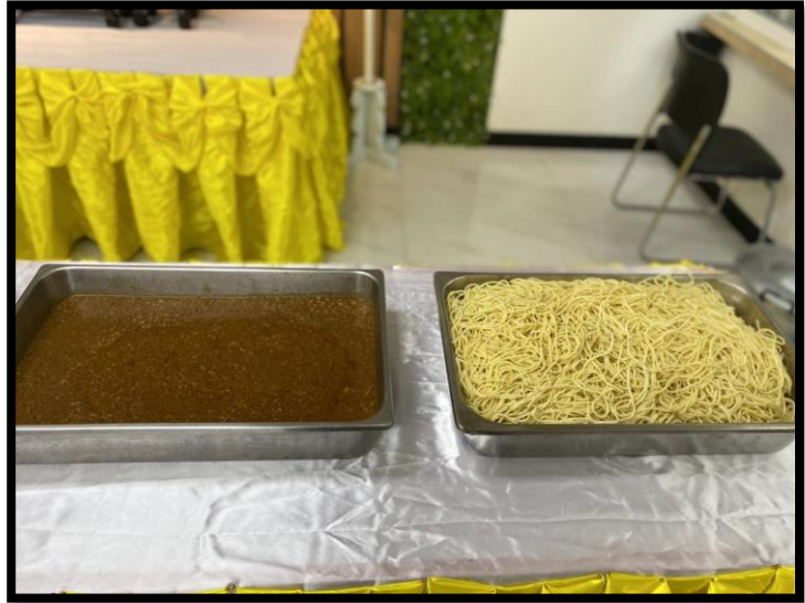
โรงพยาบาลบางน้ำเปรี้ยว